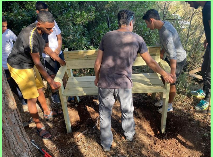
מכינת אחד משלנו